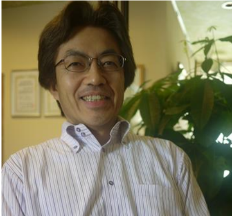
講師：ナチュラル心療内科クリニック